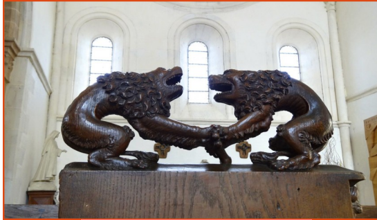
Relation à l'autre

La juste perception de l'autre, de ses émotions, des messages qu'il nous adresse, est indispensable au bon développement des relations sociales. Dans la schizophrénie cette perception plus ou moins perturbée est handicapante. La détermination de ces troubles relationnels est une des cibles de la recherche actuelle sur cette maladie.