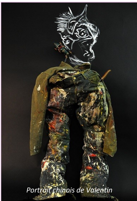
Portrait chinois de Valentin

L'association met à leur disposition tous les moyens matériels utiles à la réalisation de leur œuvre. Cette année, elle a mis en place un studio photo professionnel comprenant des boîtes à lumière, des flashes synchronisés, des fonds de studios, le logiciel Photoshop ainsi que châssis, toiles, peinture, fusains et tous les médiums dont ils ont besoin au gré de leurs créations.