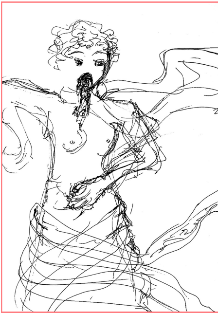
Chimère Œuvre de Sébastien Membre de l'association Arts Convergences