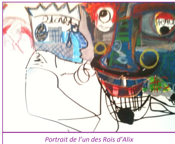
Portrait de l'un des Rois d'Alix